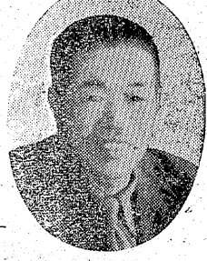
眞寫 鹿島 上野 下 志賀 氏部 氏部