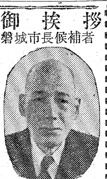
立花秀吉 立ちはなひてきち