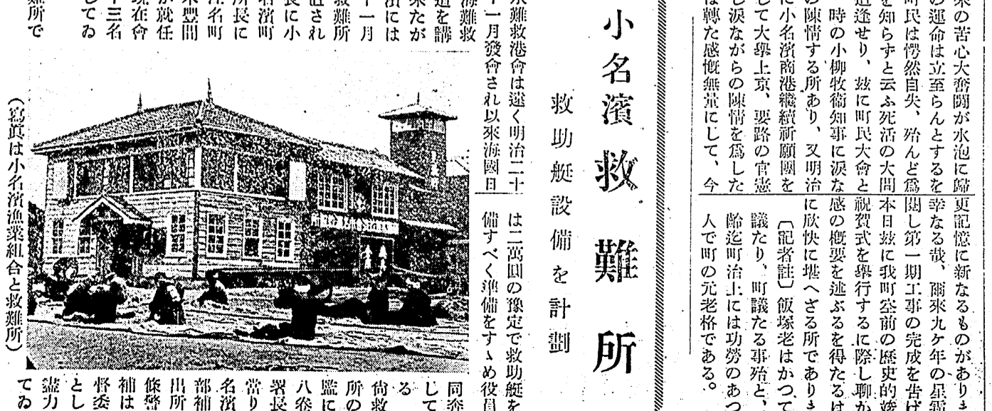
小名濱救難所 救助艇設備を計劃