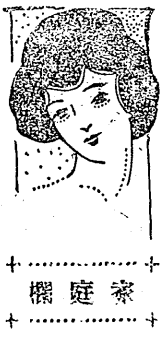
酸化炭素中毒に就て

石城郡地方の農村が最近副業養兔を行ふに至り到處普及されるに及んだので利を見るに賢き賣買商人等は農村が一般市價に比せざるを奇貨とし市價に比較して三割内外位で農村から買入れ暴利を貪りつゝあるを見たので郡農會は折角有利なる事業として農村に化炭素であることが判り又從來炭火がまつかになつたこの酸化炭素が少くなるやうに傳へてゐたが却つて赤くなる多くなること判つた、これに中毒すると頭痛、耳鳴、めまひ、顔面紅潮、手足麻痺の症狀を起し知覺を失ふて動けなくなる若しよみがへつても神経系統の病氣を起すことがしばしばあるから注意すべきだ要するに鐵筋コスクリートの洋室には炭火は嚴禁であり外氣と交通ある日本室でも外氣よりも四度以上暖めると酸化炭素がたまる何うしても炭火を焚く時には時々外氣と空氣を交換しなければ危険である。