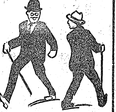
正札堂 通場車停町平

ヤア君か、ヤア君か、 見違へたよ、 お互ひに餘り 立派な洋服に なつたので…… 朝日夕日雨にも便利なる 敷島のヒヨケ如何にと人々わは