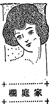
春のむ座敷手人(上) 欄庭家

遺留品の手懸りとしては被 害者の枕元にあつた血染め の薪割りであるが此外大越 家裏手の山の中にあつたモ ジリ外套も遺留品でないか と云はれて居るが是れは少 しも血痕の附着して居ない 點より見て兇行前に抜き捨 てたものか夫れども全々別 人のものであるか判明しな