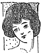
春の粧座敷手入(下)

石城郡小名濱町字本町松五更に乾いた布で木の目通りに拭きます。床の間の塵は高い棚のやうな所はハタキをかけますが、床板の所はかへつてそつとはい方方が塵が飛ばないでよろしいです。床の障子は特に綺麗にしておく事をお忘れにならないやうに、なほ申し添へたい事は床の間にゴテ