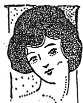
家庭料理各種 (一) 家庭欄

石城郡内郷村の大字高坂では先年統一したる部落林野卅七町歩の地上權を設定し本春柵十二萬本の植栽を計畫し千葉同郡駐在林業技手により設計中であるが同造林は自後十年後の伐採價格一本五十錢つととして六萬圓を以てこの肉が充分浸るだけの醬油の中に、四日間くらの漬けておき、とき々裏がへしてよく醬油を沁ませます。これを薄く切つて、ポイルドポテトなどを附合せていただきます。一寸お客様にも出せますから大變重寶です。煮込みうどん、干鰯鮓を充分軟かく茹でておきます