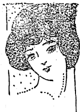
新里芋の賣方 (二) 家庭欄