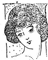
洗濯物に依り 石城の適否がある

(第六信)八月十一日晴 今日限りだと思ふと床離れするの、惜しい様な氣がしてなりません、やつと起き出て寝具、その他荷物をすつかりかたづけました、部屋の