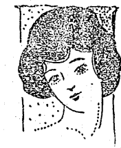
炬燵の時期 唇の荒に御注意

石城郡地方各町村は昭和三年度前後期分共縣稅の滞納が甚だしく平町の六千餘圓を筆頭に郡内三十餘箇町村平均七百圓餘總額三萬六千餘圓の滞納があるので去月十九日縣から係官出張元石城郡衙に於て郡下各町村の滞納者に對して差押への處分を行つた結果差押への方は漸く一段落を告げ目下納稅通知書の整理中であるが差押へ開始以來納付して