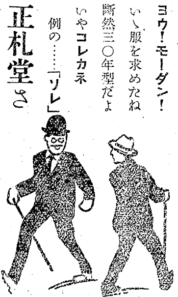
六三四電通場車停目町四町平