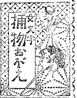
東京 (橋本) (其一)