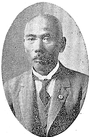
推 薦 廣 告

◇しか 鹿の角を鹿角といひ、軟かな初角の蔭干品を鹿茸といひます。ともに強壯劑として用ひられます