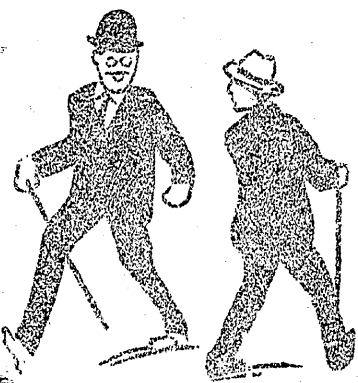
六三四電通場車停目丁四町平

ヨウ! モーダン! いゝ服を求めたね 断然三一年型だよ イヤコレカネ 例の……「ソレ」