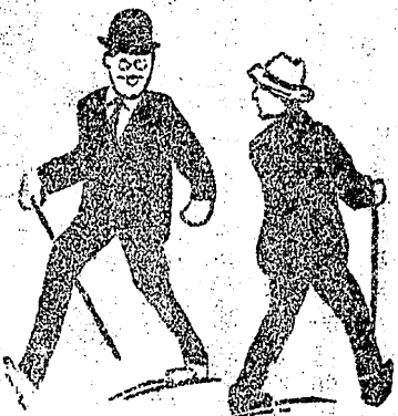
六三四電通場車停目丁四町平