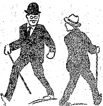
平町四丁目停車場通電四三六