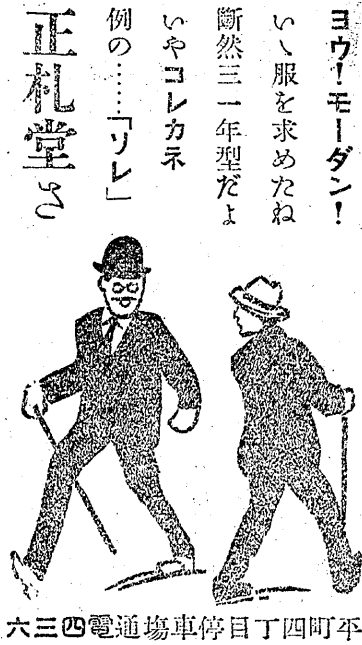
六三四電通場車停目丁四町平

セメント 壁用材料 コールタール ペンキ塗料 板 ガラス 磐城セメント株式会社 代理店 西村屋藥舖 平町二丁目電話三