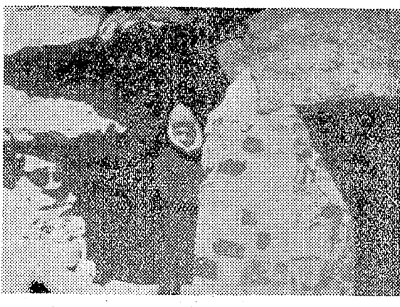
(長社本崎川るけに跡戦順旅)

松ヶ岡は例年より早い。平地方は二三日來の日和積きに氣温もめき／＼と上騰し、透明な蒼空にくつきりとして春が訪れて來た。梅は既に満開を呈し、木の芽も大分ふくらんで來た。殊に快晴にめぐまれた昨日の日曜は、松ヶ岡公園やその他に樹林を縫ふ散策の人々で終日賑ひを見せてたが、この分で行けば、櫻の開花期も例年よりは、大分早目になるだらうと見られて居る。