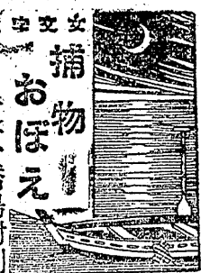
東京橋場射刺 (采田安藤)