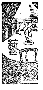
村役場 (童謡詩) 市川健次

都會には都會、農村には農村の自然の動きがある。この兩者を圓く進ませる所に眞の政治の力がある。今日、民衆のうらみははやともするとこの兩者に片手落ちが見出されるからだ。人間は人間であつて神ではない、故に少しのつまづきはある。又一面これが良きものを生む原動力となつてゐることは過去の歴史が明かに語つてゐる。故に許してやるべきだ。これを捕えて責めるのは責める人自身を小さくすることだ。無産黨が既政黨の小さな蹉跌をとらえてガナル。いかに美しい町にも便所はあつてこれをきたないといふて立小便をすることを是だと云えるか。便所は使所らしく美しくあらすればいいのだ彼等が理で押すなれば、今日無産運動の先頭に立つ人々に眞にハンマーや鋏を握りあるひは田の草をとつた経験のある人が幾人居ると問ひたい。民衆はややもすると、代表者は我等の番頭であると