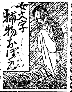
東京橋場鮎刺 (米田安藏畫)

お千代は心淋しく王子の稽首へ 参詣した。 其の王子には海老、扇屋と云ふ可なりな二軒のお客屋があつた。秋の頃は紅葉の客で難詰するのだが、平常は至つて静かなのだ。紅葉に次では初午の季節だ、王子の稽首は名高いもので、天正の年間寄上人が、王子権現の別荘であつた時、観音様と薬師様と稽首様を、稽首の神としてまつたと云ふ由緒がある。夫是れで何處にもある……伊勢、稽首に、馬の糞……の類では無い、初午の賑やかさなどは、今の人の想像も及ばぬ位のもつた、夫れ人出も多し申しませう。