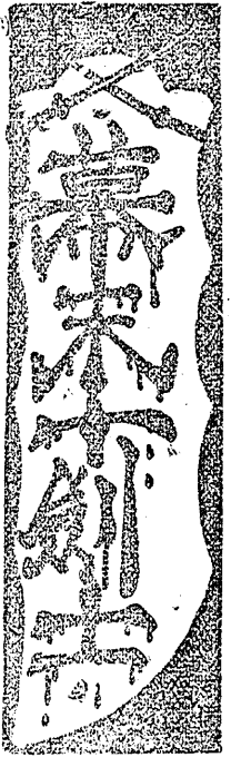
【禁轉載上演及映畫】