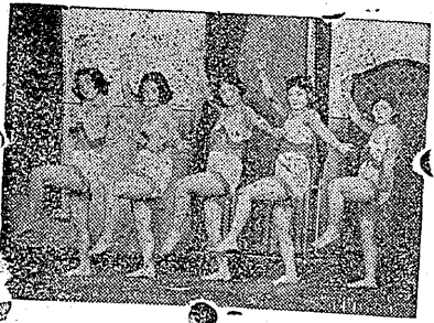
札止めされることを豫想されて居る。

縣下中等柔剣道大會は昨日のは大衆向とし、又一段の歡迎を受けるものがあり開演前に大入満員となつた