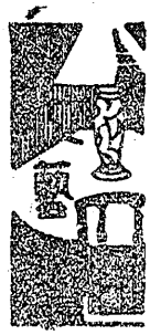
沼の霧 平野 志美

冷々してくる 沼の霧 樹肌がくろぐろ濡れてゐる しんと寂しい 沼の霧 蘆間にひくく啼く小鳥 冷々してくる 沼の霧 木の間に明つて行く夜汽車