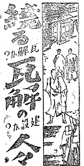
瓦解の謎 (上) 悟道軒圓玉 (作) 丸尾至陽 (畫)