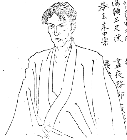
誰云今日開化春 断酒禁色真木佛 死生場頼三尺杖 唯存去來中樂

いくこともできない。東京がだん／＼狭くなつていつた、もう五尺の身の置きどころもないといふありさま……。また、西郷から借用の燕尾服を脱いでもとの淺黄木綿の着流し九腰となつて世を忍んでゐるが、一度身につけた燕尾服にエナメル靴に、黒帽子に、いさゝか愛着を覺えぬでもなかつた。——はて……。怖ろしいことだとおもつた。身の墮落の第一歩だとおもつた。