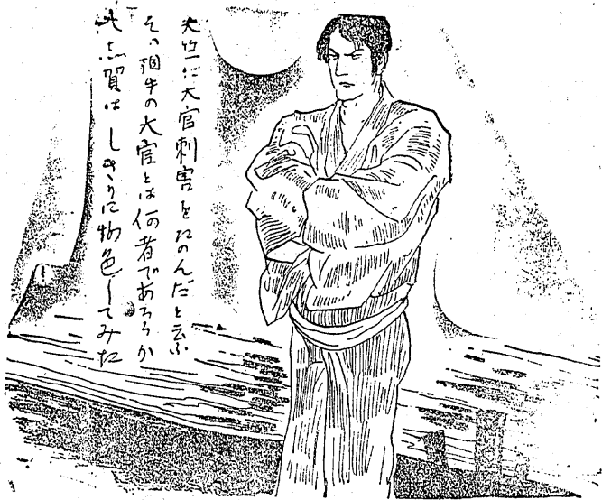
大志賀に大官刺害をたのんだといふ。その相手の大官とは何者であらうかと大志賀は、しきりに物色して

天竺くに大官刺害をたのんだといふ。その相手の大官とは何者であらうかと大志賀は、しきりに物色し