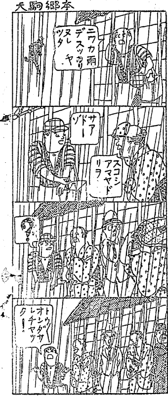
20人ヤチシノのよとひお