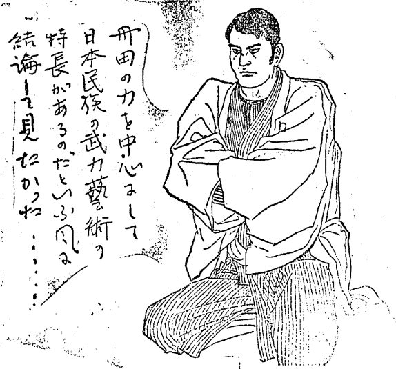
舟田の力を中心として日本民族の武力藝術を術の特長があるのだといふ結論を見なかつた。

内にも日本人独自の正座主義をすて、他民族の悪習慣を真似て椅子に腰掛する事やホークやナイフを使ふ事を光榮とする事が流行した。茂平次自身も現在ホテル館の一室で椅子生活をやつてゐるが經濟本位、勞働本位能率本位の腰掛も、或程度まで利用して良が家庭にあつては斷然正座に限ると思つた。