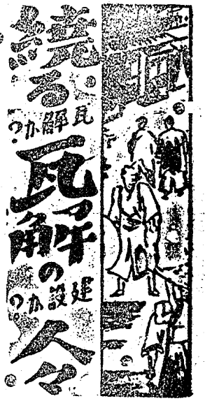
瓦解の設計人 悟道軒圓玉 (作) 尾至陽 (書)