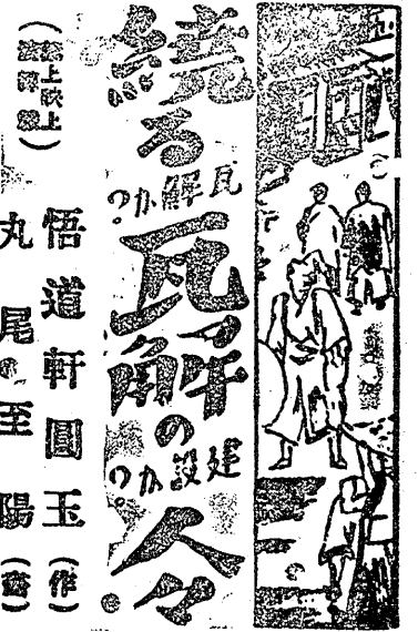
(著上原) 尾至陽 (畫) 悟道軒圓玉 (作)