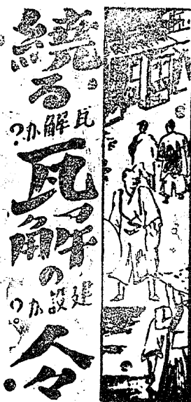
（橋上） 悟道軒圓玉（作） 尾至陽（書）