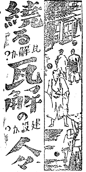
続る解瓦解の設 (作) 悟道軒圓玉 (書) 丸尾至陽