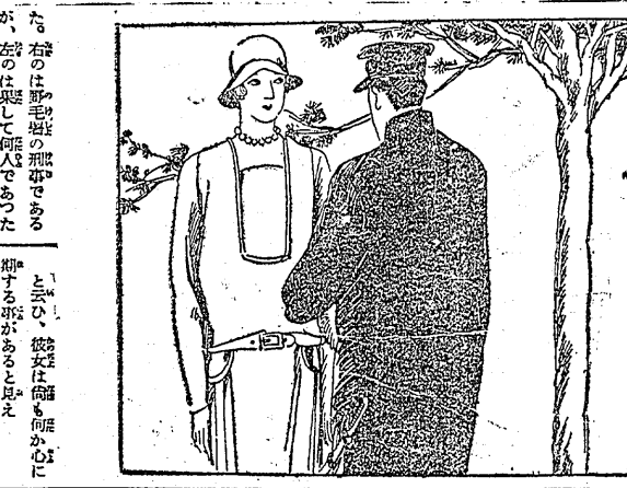
結婚許可證の発行を待つ二人の姿。