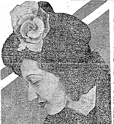
これは、この二、三年の流行傾向から、心がけてください。