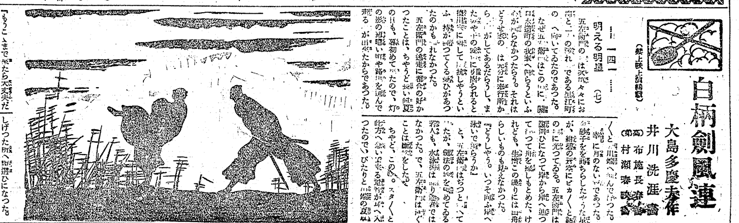
白柄劍風連 大島多慶未作 井川洗滌齋