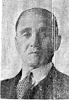
年頭のことば 縣會議長 蓮沼龍輔

独立日本を築き上げた日の出の輝きと、 共に、我が郷土平市の一大飛躍の 巳年を迎え、われらの懸望は一入 巳年を迎え、われらの懸望は一入 巳年を迎え、われらの懸望は一入