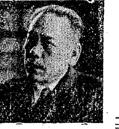
町村合併と地方開発 新春早々重要な話題

努力を怠らぬ一層の進歩を所望し、 たしなむと願ふを祈るに、 たしなむと願ふを祈るに、 たしなむと願ふを祈るに、