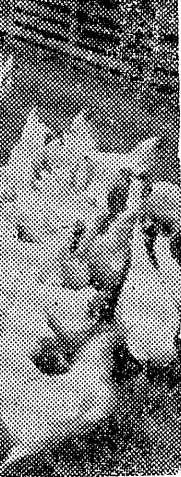
盛んな養鶏副業 最近ここでも見られる 冷害の風におそれられた石城地方の 農家は、養鶏による収入増大に 努力している。写真は、平市で 行なわれている養鶏の指導員 の指導を受ける生徒の様子。

東京服装学院連鎖校「林高等服装 女学院」院長林力女史は「 目下新入生を募集集中だが、 ▽紳士服裁断実習▽自由教育 ▽編物科が同校の特色で本科、 研究科、夜間速成科、栄養科に 別れ、希望者には寄宿舎の設備 もある、入学式は四月五日行 の予定。