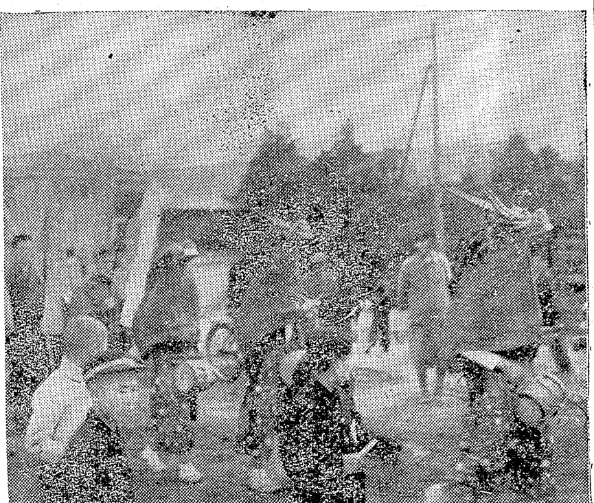
……写真は「産業文化祭を祝う獅子舞」……