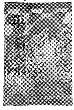
菊まつりの様子 (写真は菊まつりのボスター)