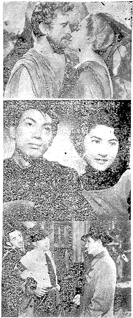
写真説明 ◆白上段ひかり座上映の(ユリシイズ) ◆中段平館上映の(女中ツ子) ◆下段聚楽館上映の(三つ数えろ) ◆左の記事中は世界館上映の(五十圓横町)