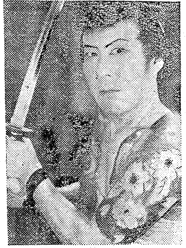
……(写真説明)…… (右上)楊貴妃 (中)うちのお婆ちゃん (下)マルタ島攻防戦 (記事)旗本やくざの各一場面

悪魔の病を癒している老練の破れしんぼは、はき取つて行く。強敵非道な高利貸、大黒屋徳兵衛の店へ若い浪人が入つて来た。その浪人からさんざん聞いて貰ひ上げた一面の刀だ、ヒゲの浪人が十面を振り回すと五面の手付けを置いて帰つて行つた。