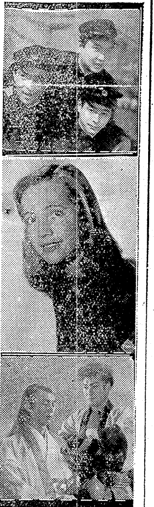
写真は…(上) 大学は出たけれど一場面(中) 青い麦の一場面(下) 美男剣法の一場面(記事上) 私の拳銃は素早い(向) 秘境ザンジバーの一場面