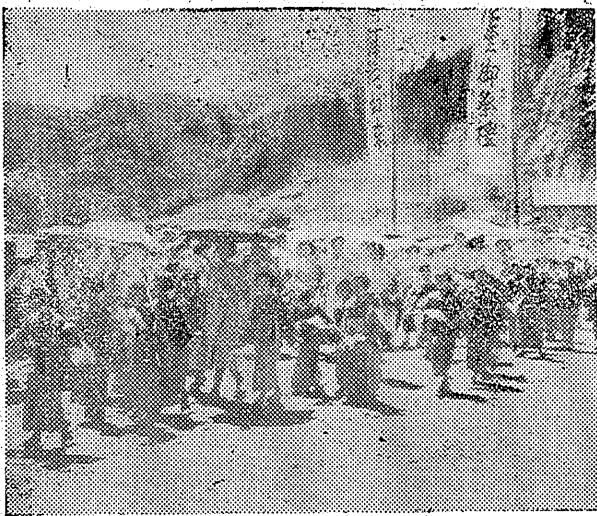
台風十二号の暴風雨。市内各所に被害あり。写真は午後八時、寺町方面から赤井橋上