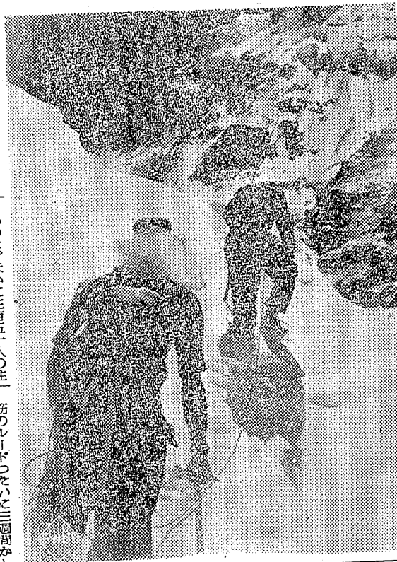
この映画は、この世紀の壮業を、1時間20分の天然色映画に記録したものでその中には1922年及び24年の遠征の際の貴重なフィルムのほか、登頂約一週間後インド空軍によって撮影された空中写真もそう入されている。

世界の最高峰エヴェレストは29,002フィート(8,840メートル)我が国で一番高い富士山が12,395フィート(3776メートル)であるからその二倍近い高さである。このエヴェレストを目指して、過去30年間に10回の試みがなされたが、どれ一つとして頂上を極めるに至らなかった。かくて、第11回目の企てが、英国地学協会並に英国山岳会により、エリザベス女王御冠の年に行われた。周到な科学的準備を固めて、ハント大佐指揮の一行がネパールの首都カトマンズを出発したのは1953年3月、それから2か月半後の5月29日午前11時30分一行の中、ヒラリーとテンジンの二人が遂に地球最高の地点に人類最初の足跡を印すことに成功したのである。この映画は、この世紀の壮業を、1時間20分の天然色映画に記録したものでその中には1922年及び24年の遠征の際の貴重なフィルムのほか、登頂約一週間後インド空軍によって撮影された空中写真もそう入されている。