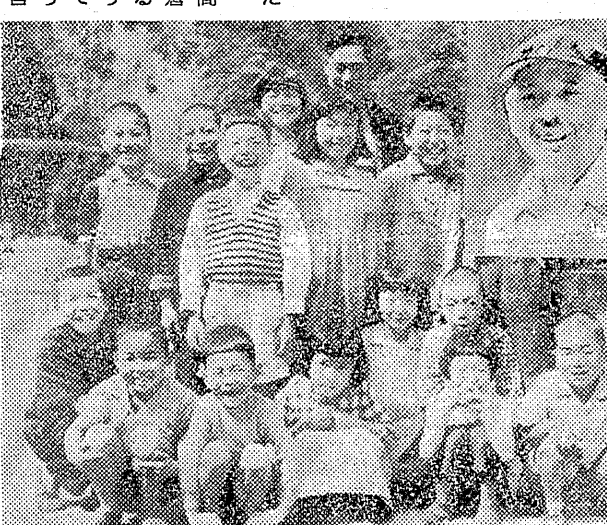
山の子らを守り抜く鷲先生

秋に千二百年祭 赤井岳の振興策 赤井岳の振興策を講ずる赤井岳の振興策を講ずる赤井岳の振興策を講ずる