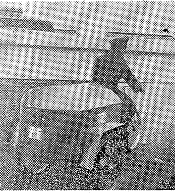
小荷物配達 が早くなる。 小名浜郵便局にこの小荷物配達 用三輪自動車は配備された。こ れは市内四島、東 を回ると、局 屋のものを、局 員は今迄数十分を 要した四島へは 約二十分位で届け られるもので、配 送時間も短縮によい のですと大喜び。 (写真小名浜局の 小包配達)