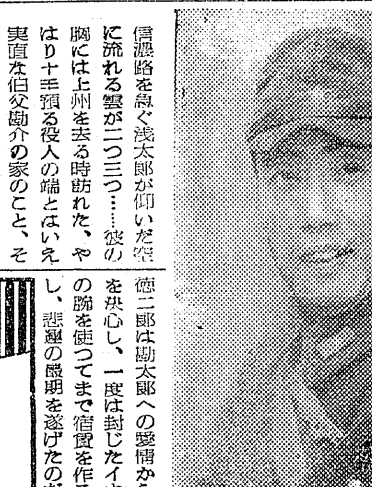
二等兵物語の伴淳