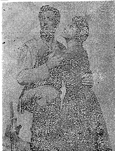
渡るべき多くの河