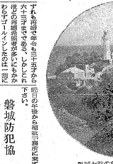
岩つつじ咲き競う夏井川溪谷

岩つつじ、秋の紅葉の名勝として知られる夏井川溪谷は、標高三三三米、海抜一六〇米の間に夏井川の清流が岩石を轟いて流れる。また付近には二見分湖や天然記念物の荒沼のワキなどもある。平からバスで四十五分。