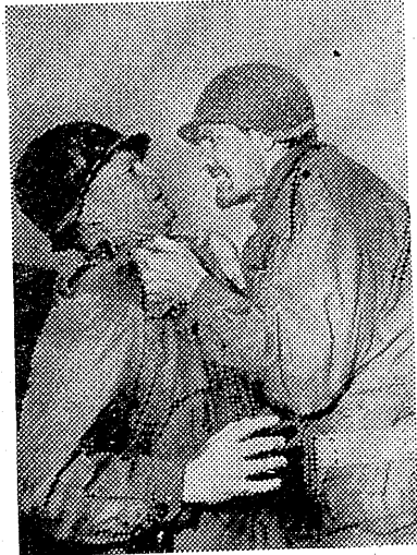
アルドリッチの第三回作品として製作された作品である。この作品は本年八月、ウエニスで開演された国際映画祭に於てイタリア批評家大賞(パシネチイ賞)を授けられた。因みにアルドリッチの第一作「大きなナイフ」は昨年銀獅子賞を受けており、連続二年の授賞に輝いている。

キヤストはハリウッドに於ける男性スターとして今や確固たる地位を築き、暗黒の恐怖「シネイン」の突然の恐怖と矢張り早やにヒット作を連ねたジャック・バラン、クローマの休日「プロアソシエイト」のエイ・ア