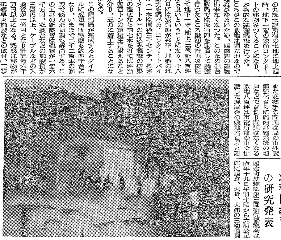
この電話局が完成するとダイヤルに交換自動電話が約四千台になり、いままで二千二百本の回線で悩んだ問題も解消する。この工事の新築費は約一億六千万円、交換台などの施設費が三億四千万円、ケーブルなどの入換費が一億四千万円、計五億六千万円以上になる。完成は建設費が来春早々施設などの取付、工事

仙台郵政局は常磐地区の特殊性から平市に自動電話局を建設することになり、四年前から平市に敷地の調査を始めてきたが、敷地難から延々になっていたもので、昨年木村副局長などの奮闘で市内三階町農業会館前の丸茂土建所有の土地に地上四階、地下二階の鉄筋コンクリートの建物をつくることになり、本格的な基礎調査を行った。ところがこの敷地は埋立地なので地盤がゆるいため、四階建ての建物は出来なくなった。このため仙台郵政局では技術陣を動員して調査を行ったところ、最初の計画を変更して地下二階地上二階延八百坪から、地下一階地上二階延八百坪に改定することになり、十九日は技術陣が来平、地盤の耐力を調べる。コンクリートパイプ(一本は直径三十七センチ、長さ十メートル)の打ち込み調査の結果、この程度なら七本を打てば坪当たり四百トンの重量に耐えることが分り、五月に着工することになった。